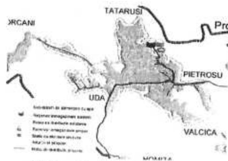
Subsistemul de alimentare cu apă Tătăruși